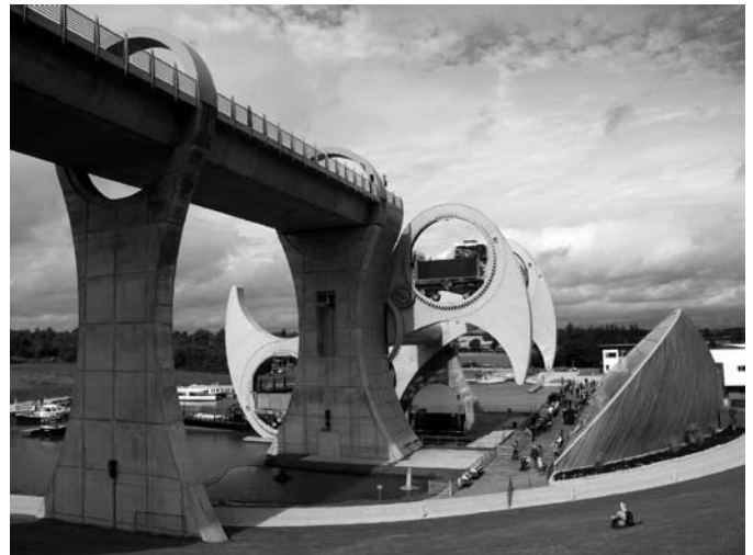
Mogelijke inspiratiebron voor een overtoom: de draaiende scheepslift (scheepswiel) bij Falkirk in Schotland (UK).

Wanneer hierbij het provinciale initiatief gevoegd wordt om samen met de dertien betrokken gemeenten de vaarweg tussen Katwijk en Rotterdam (Oude Rijn, Rijn-Schiekanaal) een toerische-recreatieve impuls te